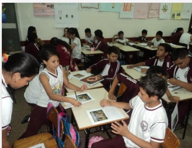
Figura10: Praticando a atividade, interpretação do aluno diante a obra Caboclo Ribeirinho.