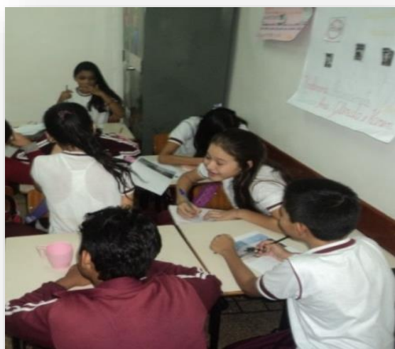
Figura 6: Praticando atividade na sala, interpretação do aluno diante a obra Paisagem.

Segundo Freire (1996, p. 52), “Ensinar não é transferir conhecimentos, mais criar as possibilidades para sua própria produção ou sua construção. Quando entro em sala de aula devo estar sendo um ser aberto às indagações, à curiosidade, às perguntas dos alunos, às suas inibições; [...]”. O professor como educador antes de tudo é um autor da sua própria construção e ao mesmo tempo um artista para atuar em sala de aula.