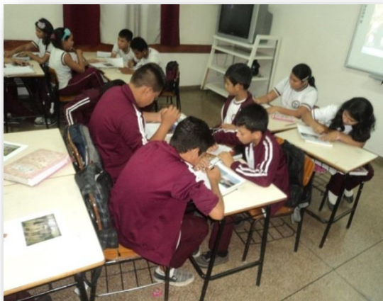
Figura 8: Praticando atividade, interpretação do aluno diante a obra Castanheira do Macurany.

vários fatores a serem conceituadas na sala de aula como o espaço modificado pelo homem, as diversidades de vegetação, o rio fonte de subsistência, o relevo é caracterizado por planalto.