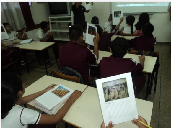
Figura4: Praticando atividade na sala, interpretação do aluno diante a obra.

um novo recurso didático pedagógico nas aulas de geografia, para que o aluno possa ter a ansiedade dos conteúdos.