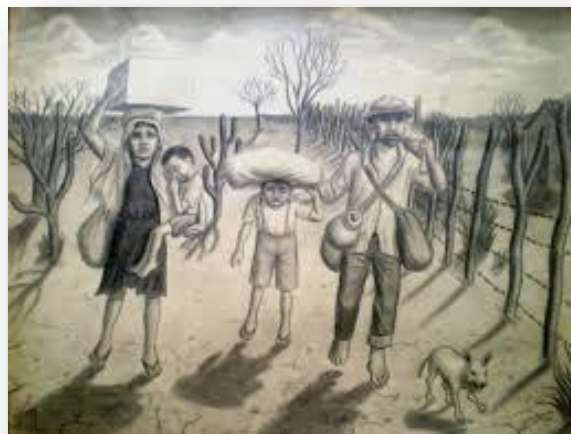
Figura5: Obra-Vidas Secas/ Graciliano Ramos