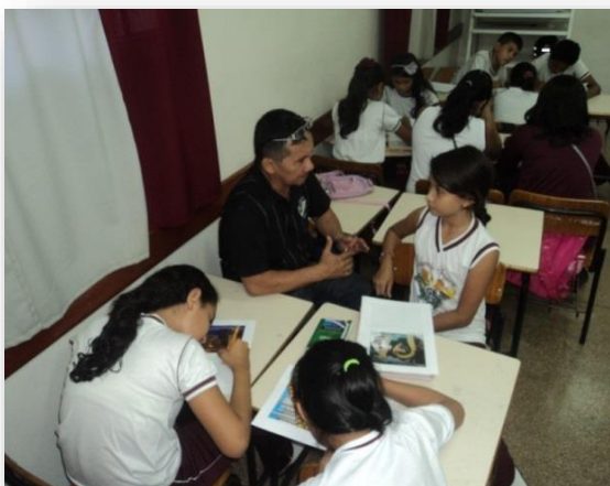
Figura2: Praticando atividade na sala, interpretação da obra.

professor da referida escola, com seu entusiasmo perante as obras contribuiu com seus conhecimentos na área de geografia, pois é possível utilizar as obras de artes na sala de aula.