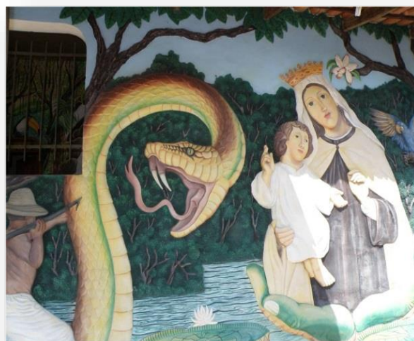
Figura 11: Obra-Caboclo Ribeirinho Fonte: Evailson Inomata/ Liceu de arte Instituto (IRAPAM)

Obra de Evailson Inomata Caboclo Ribeirinho a última obra a ser apresentada aos alunos do 6º ano, a imagem (impresso) chamou a atenção dos alunos por ser uma obra tipicamente da região local, a escrita da aluna R. C. S (11 anos) “A tela representa o típico caboco ribeirinho salvando a padroeira de Parintins das garras da “anaconda”, representada pela geografia que são as diversidades enorme de vegetação [...], enfim geografia é paisagem e paisagem é tudo o que vemos inclusive os mitos da cobra grande que representa os mitos da nossa região”. A obra (figura 11) possui diversos conceitos a serem trabalhado em sala, pois os alunos constataram a presença de vários animais especificamente a cobra grande fenômeno que aparece nas profundezas do rio.