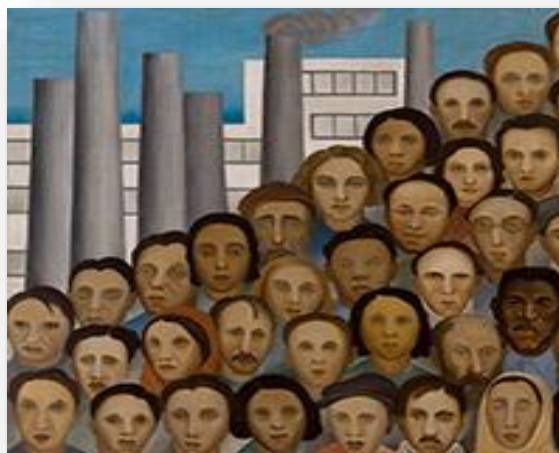
Figura3: Obra- Os Operários/ Tarcila do Amaral Fonte: http://www.portaldoprofessor.mec.gov.br

A respectiva obra na (figura 2) Os Operários, de Tarcila do Amaral de 1933, sete alunos identificaram na imagem artística (impresso) pessoas com características diferentes, os elementos geográficos e as categorias geográficas existentes na tela, temas a serem trabalhados nas aulas de geografia utilizando as telas, visto que é visível a geografia na obra, pois é possível utilizar as artes plásticas na sala de aula. De acordo com Silva (2009, s-p) “uma análise social [...] a qual destaca uma miscigenação de um povo brasileiro”. Aluna do 6º ano, M.C. B, (12 anos) descreve, “eu entendi que no Brasil é formado por várias pessoas: negro, índios, pardos, europeus, alemães, africanos... E que geograficamente o número de habitantes é imenso, [...]. Ao fundo da imagem podemos ver que há uma indústria, que é uma paisagem artificial (construída pelo homem) penso eu que antes existia uma paisagem natural [...] a indústria com a fumaça que ela produz, contribui com o aquecimento global que prejudica muito o meio ambiente”.