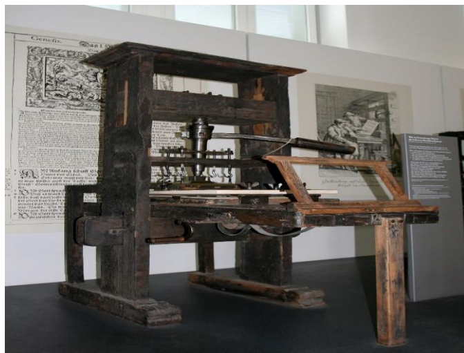
Figura 4: Prensa de tipos móveis de 1811, em exposição em Munique , Alemanha.