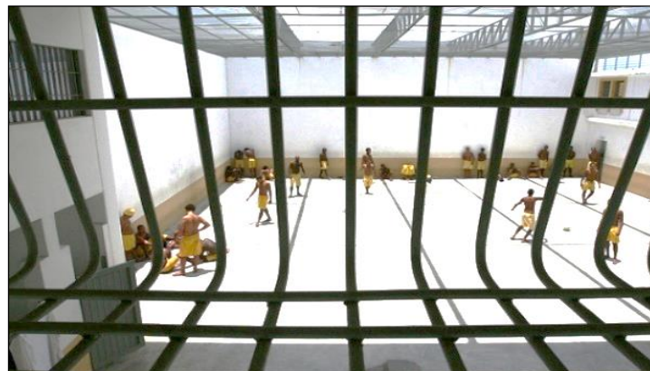
Figura 8: Sistema Prisional de Tabatinga (AM) está sob controle Presídio de Tabatinga tem capacidade para 150 detentos.