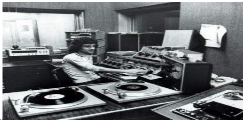
Figura 1: Fotografia Radiobrás – Estúdios

Fonte: https://acervo.oifuturo.org.br/acervo-museologico/radicos/3/ (2021).