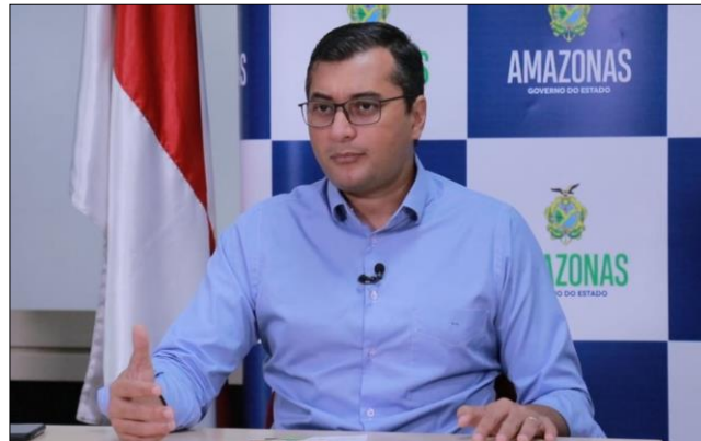
Figura 10: Governador Wilson Lima