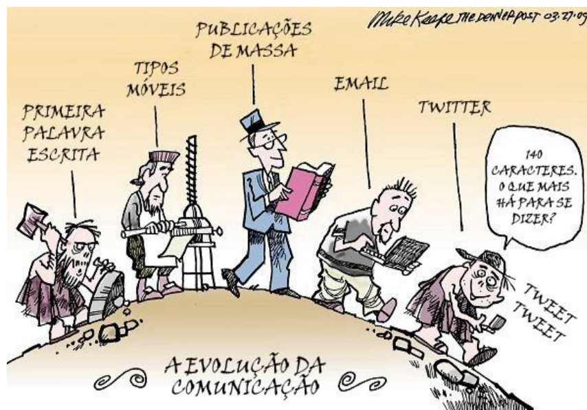
Figura 5: Charge A Evolução da Comunicação