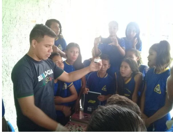
Figura 4: Fonte Pimentel 2019

Dia 25/03/2019 - Ocorreu a feira de ciências da Escola “Municipal Irma Cristine”, educandário onde foi realizado o trabalho com os alunos, a aceitação da caixa entomológica feita pelos alunos foi tão proveitosa que a mesma fez parte de um dos estandes em meio a vários outros trabalhos científicos realizados por outras turmas (figura 5).