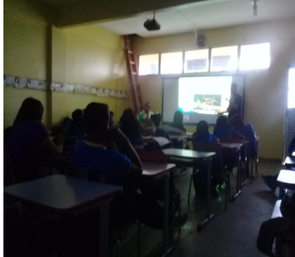
Figura 1: Fonte Pimentel 2019

Dia 23/03/2019 – deu-se prosseguimento no conteúdo que foi iniciado no dia anterior, após a conclusão da aula teórica, no tempo restante de aula, a sala foi dividida em 5 (cinco) grupos e em cada grupo foi aplicado o questionário para que fossem avaliados sobre o conteúdo explanado. Em seguida expliquei todo o procedimento que se sucederia na construção da caixa entomológica, por serem crianças de 11/12 anos, seria de alta periculosidade deixá-los manusear sozinhos alguns produtos que seriam utilizados na construção da caixa. Logo após saímos da sala de aula para a área externa da escola para a coleta dos insetos e cada grupo ficou responsável de coletar uma espécie de inseto.