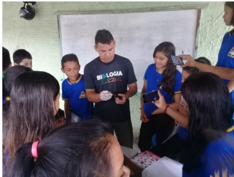
Figura 3: Fonte Pimentel 2019