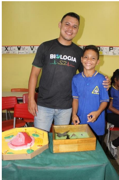
Figura 5: Fonte Pimentel 2019

Dia 25/03/2019 - Ocorreu a feira de ciências da Escola “Municipal Irma Cristine”, educandário onde foi realizado o trabalho com os alunos, a aceitação da caixa entomológica feita pelos alunos foi tão proveitosa que a mesma fez parte de um dos estandes em meio a vários outros trabalhos científicos realizados por outras turmas (figura 5).