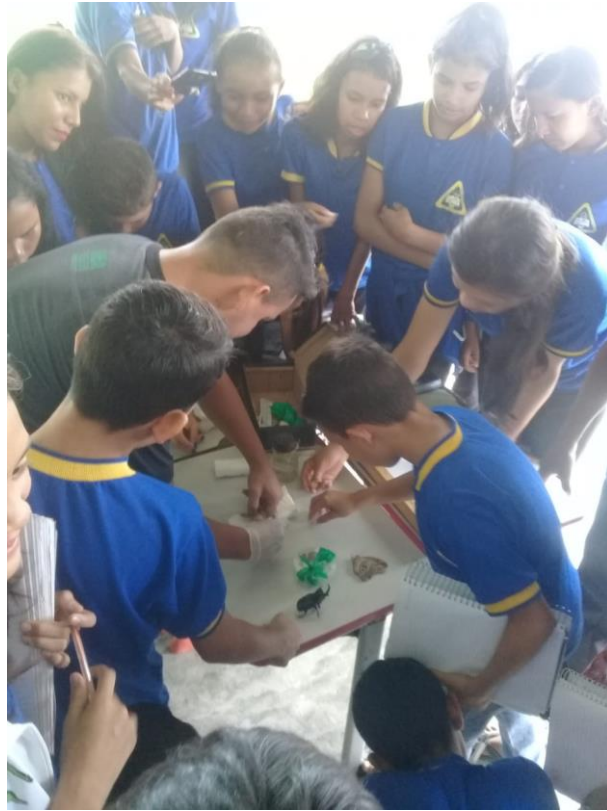
Figura 2: Fonte Pimentel 2019