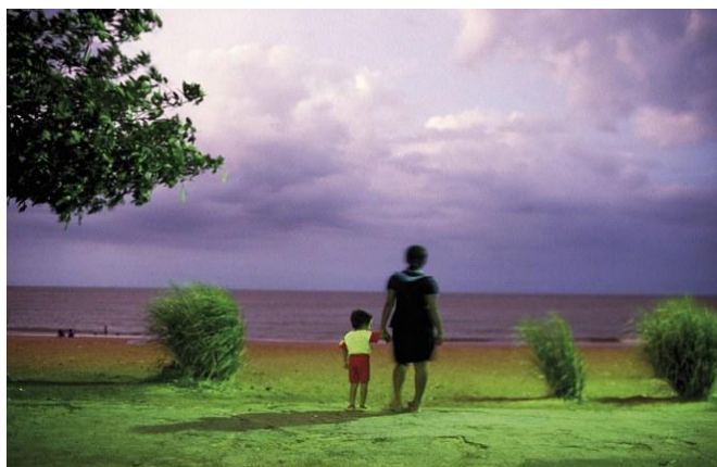
Figura 2: fotografia Baba Patchouli (1986)