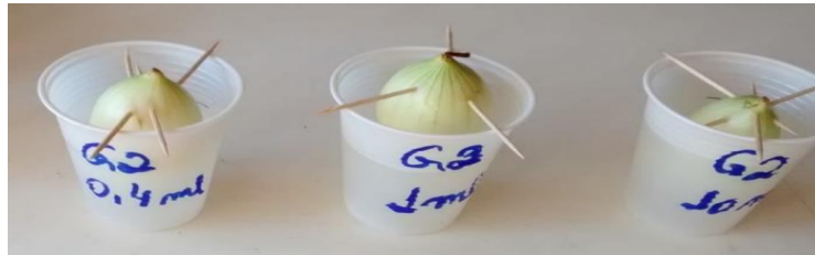
Figura 1: Montagem do experimento