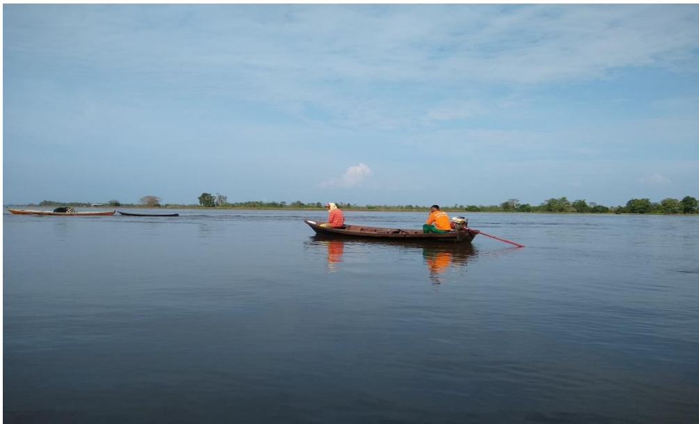
Figura 12: Pesca no lago Fonte: Trabalho de campo, 2019. (Foto: Daniela Canto).

Outra prática importante para comunidade nossa Senhora de Nazaré é a pesca , que envolve gerações: netos, filhos, avós, compartilhando saberes tradicionais. O Lago Zé Açu compõe subjetividades unidas a crenças, lendas e significados que dão sentido para a existência da comunidade. O Lago também é a rua dos ribeirinhos, pois os rios os levam-nos e os trazem para onde querem ir.