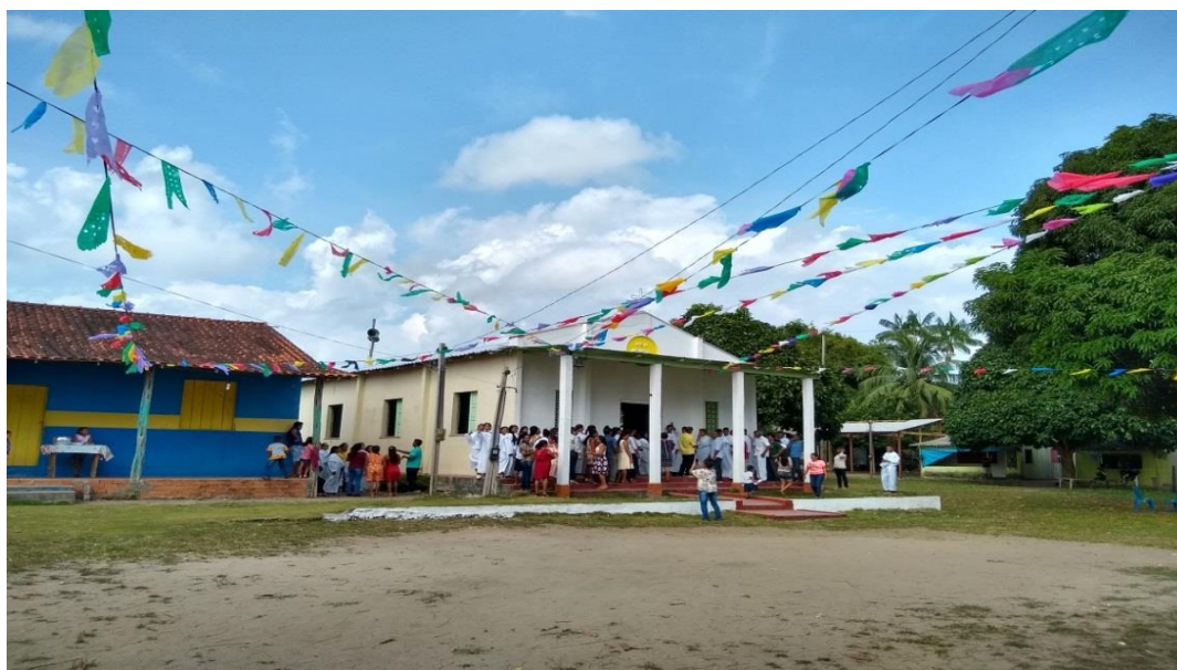
Figura 14- Festa em honra a padroeira da comunidade.

Essa dependência torna a igreja partícipe de todos os movimentos e decisões da comunidade. A festa em honra a padroeira que ocorre todo 08 de setembro, é um dos eventos principais e mobiliza toda região, como podemos perceber na figura 14.