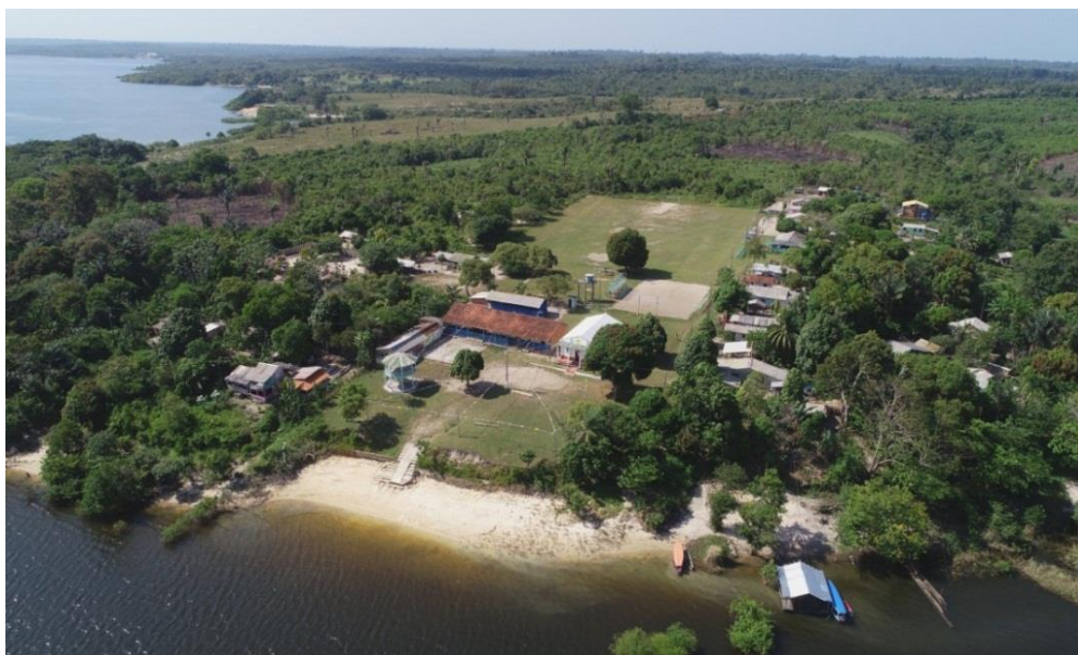
Figura 8- Imagem panorâmica da Comunidade Nossa Senhora de Nazaré. Fonte: Trabalho de campo, 2019. (Foto: Daniela Canto).

A comunidade Nossa Senhora de Nazaré é um lugar de resistência para aqueles que decidem ali permanecer, mesmo diante do descaso do poder público para com as necessidades básicas: saúde, alimentação, água potável, entre outras demandas. Pensar na economia atrelada à conservação ambiental, é uma preocupação constante para os comunitários, porém existem desafios. Segundo a fala de Ricoveri (2012, p 23), “o domínio econômico e cultural conquistado pelo mercado capitalista penetrou profundamente em todos os aspectos da sociedade”, firmando um sistema predatório aos recursos naturais que anulou muitos modos de vida e pensamentos, que levados em consideração, poderiam ser alternativas viáveis para a conservação ambiental. A autora remete-se às comunidades tradicionais, aos povos indígenas, quilombolas, nascidos e criados nesses espaços naturais e que tem muito a ensinar sobre.