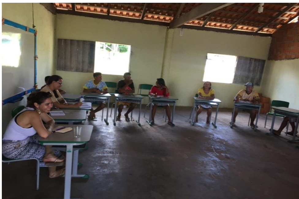
Figura 15- reunião dos comunitários onde foi apresentada a nova proposta de associação. Fonte: Trabalho de campo, 2019. (Foto: Daniela Canto).

Em 2019, os comunitários se reuniram com o propósito de mudar o nome e a proposta da associação para suprir a necessidade atual da comunidade. A associação passaria então a se chamar Associação dos Moradores, Pescadores e Produtores de Nossa Senhora de Nazaré-Amanazaré. A figura 15 retrata uma das reuniões para apresentação do novo estatuto da associação. Não foi possível ter acesso ao estatuto, pois não estava finalizado.