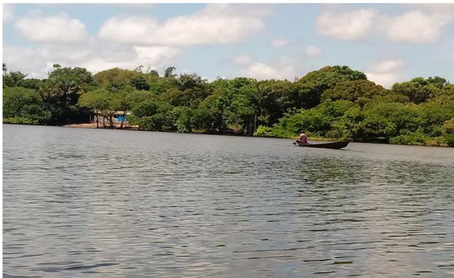
Figura 5- Pescador no lago Zé Açú.

fluxos dos tracajás na região. A figura 5 reflete as relações dos comunitários com o lago, bem como com prática da pesca.