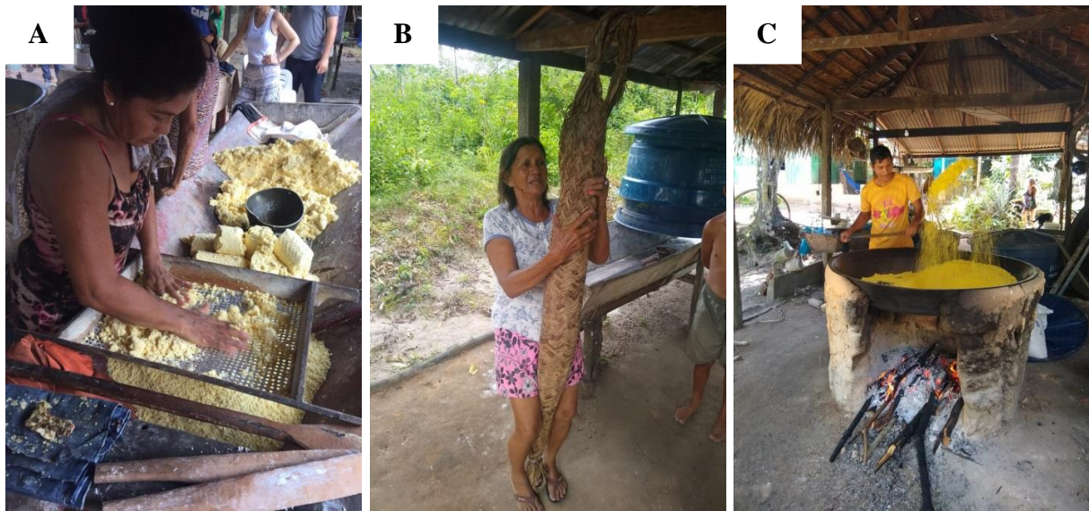
Figura 11: Tratamento da mandioca e confecção de farinha a) Maceração da mandioca; b) Processo de escoação; c) Preparo da farinha. Fonte: Trabalho de campo, 2019. (Foto: Daniela Canto).

Na figura 11 podemos verificar como é feito o tratamento da mandioca após sua colheita. Na imagem (A, percebe-se as mulheres trabalhando na mandioca, ralando em materiais preparados artesanalmente. Na imagem (B), a comunitária manuseando o tipiti, que também é feito artesanalmente de palha trançada, e serve para comprimir a mandioca para retirar o líquido chamado de tucupi, bastante utilizado na gastronomia amazônica. A imagem (C) mostra a “casa de farinha” onde se prepara, com um trabalho manual e árduo, a farinha, alimento que não pode faltar na mesa dessas pessoas.