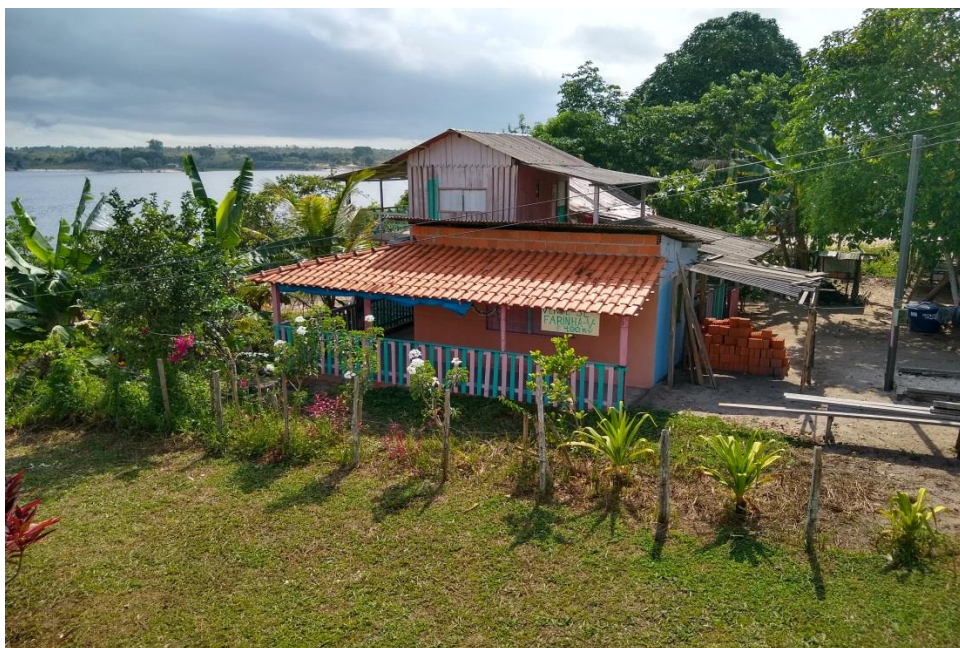
Figura 13- Casa de um dos comunitários.

Essa estratégia é para alcançar principalmente quem vem de fora, nas embarcações de passagem, pois muitos comunitários produzem sua própria farinha. E até fazem “puxirum” (trabalho coletivo, sem fins lucrativos, baseado na ajuda), juntando duas ou mais famílias para a preparação desse produto, havendo a divisão igual ao final da produção. Geralmente, isso acontece com quem tem a mandioca, mas não tem a casa de farinha, então há uma ajuda mútua para que ambos tenham acesso ao produto.