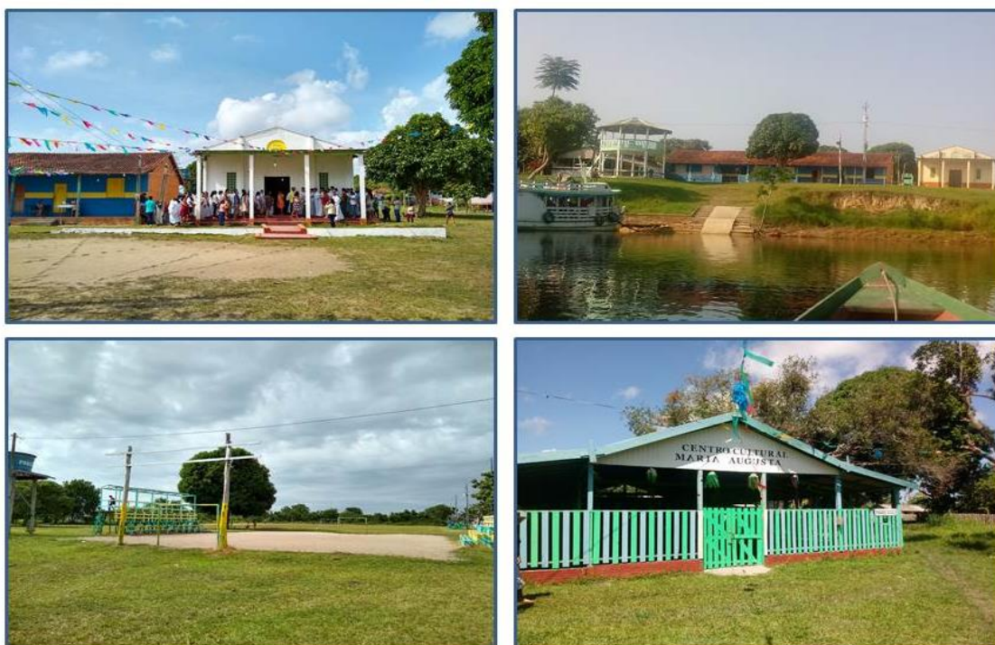
Figura 4- Igreja; escola; campo de futebol e centro cultural.

Ao chegar à sede principal da comunidade, é possível avistar a igreja, a escola e atrás da igreja o campo de futebol, assim como narrado por Cerqua (1980) na formação nas primeiras comunidades de Parintins (Figura 4).