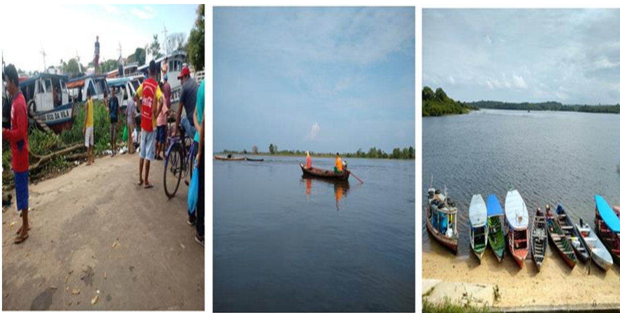
Figura 3- Embarcações de recreio e conduções próprias dos moradores. Fonte: Trabalho de campo, 2019. (Foto: Daniela Canto).

A comunidade Nossa Senhora de Nazaré está localizada a 14 km da sede municipal de Parintins. O único acesso é por via fluvial. Existem no município algumas embarcações que cobram passagem para levar à comunidade, essas embarcações são chamadas de “barco de recreio” e têm horários marcados para saída e retorno. As figuras em destaque representam o referido tipo de transporte.