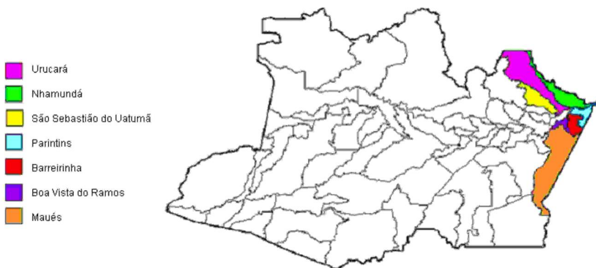
Figura 1: Representação Cartográfica dos Municípios do Baixo Amazonas

A região do Baixo Amazonas ocupa uma área de 107.029,60 Km 2 o que representa 6,8% da área total do estado do Amazonas (1.570.746 Km 2 ). Compreendendo uma microrregião do estado, o Baixo Amazonas é formado por sete municípios: Barreirinha, Boa Vista do Ramos, Maués, Nhamundá, Parintins, São Sebastião do Uatumã e Urucará, estimando um número populacional de 230.847 habitantes, que corresponde a 7,2% da população do Amazonas (Plano de Desenvolvimento Rural Sustentável-PTDRS, 2010).