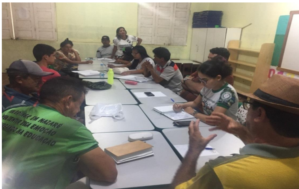
Figura 16- reunião dos comunitários junto a universidade.

A figura 16 é referente a uma reunião da cooperativa Coopazçu com alunos e professores da universidade. É importante destacar o apoio institucional que a cooperativa teve desde sua criação. Nos anos de 2015 a 2017, a Coopazçu recebeu consultorias da Incubadora Amazonas Indígena Criativa-AmiC da Universidade Federal do Amazonas-UFAM, o que possibilitou capacitações, palestras e reuniões entre os cooperados sobre variados temas em prol de uma maior participação e organização social.