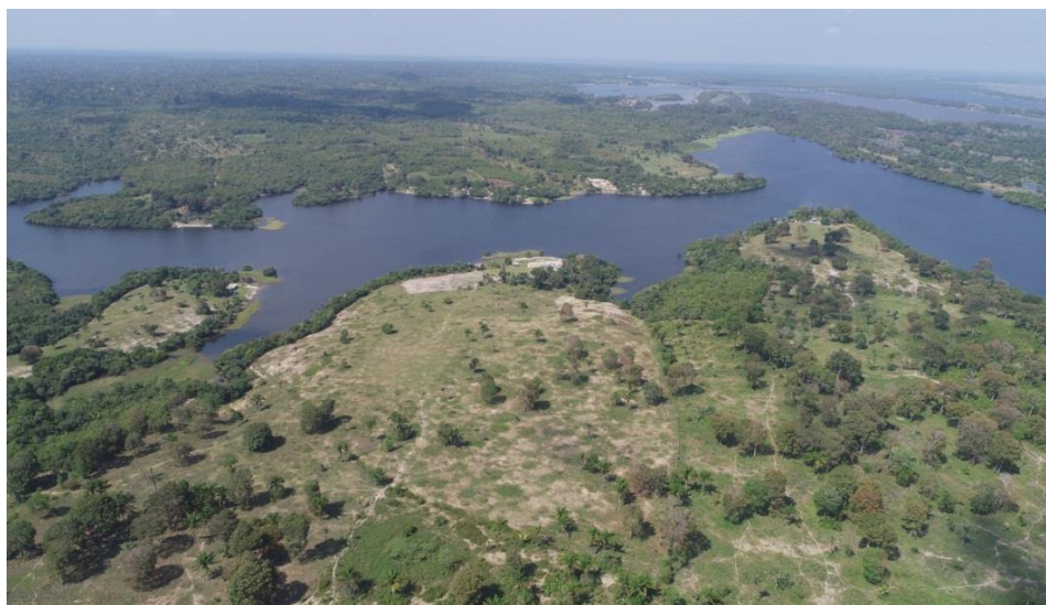
Figura 7- Áreas desmatadas no entorno da comunidade. Fonte: Trabalho de campo, 2019. (Foto: Daniela Canto)

em estratégias que diminuam a poluição e a degradação ambiental nessas comunidades, é um desafio, devido a proximidade com o meio urbano, as poluições, lixo, as grandes extensões latifundiárias de criação de gado, exploração de madeira, areia e outros recursos naturais da região. Na figura 7, podemos observar uma considerável extensão de terra desmatada para criação de gado.