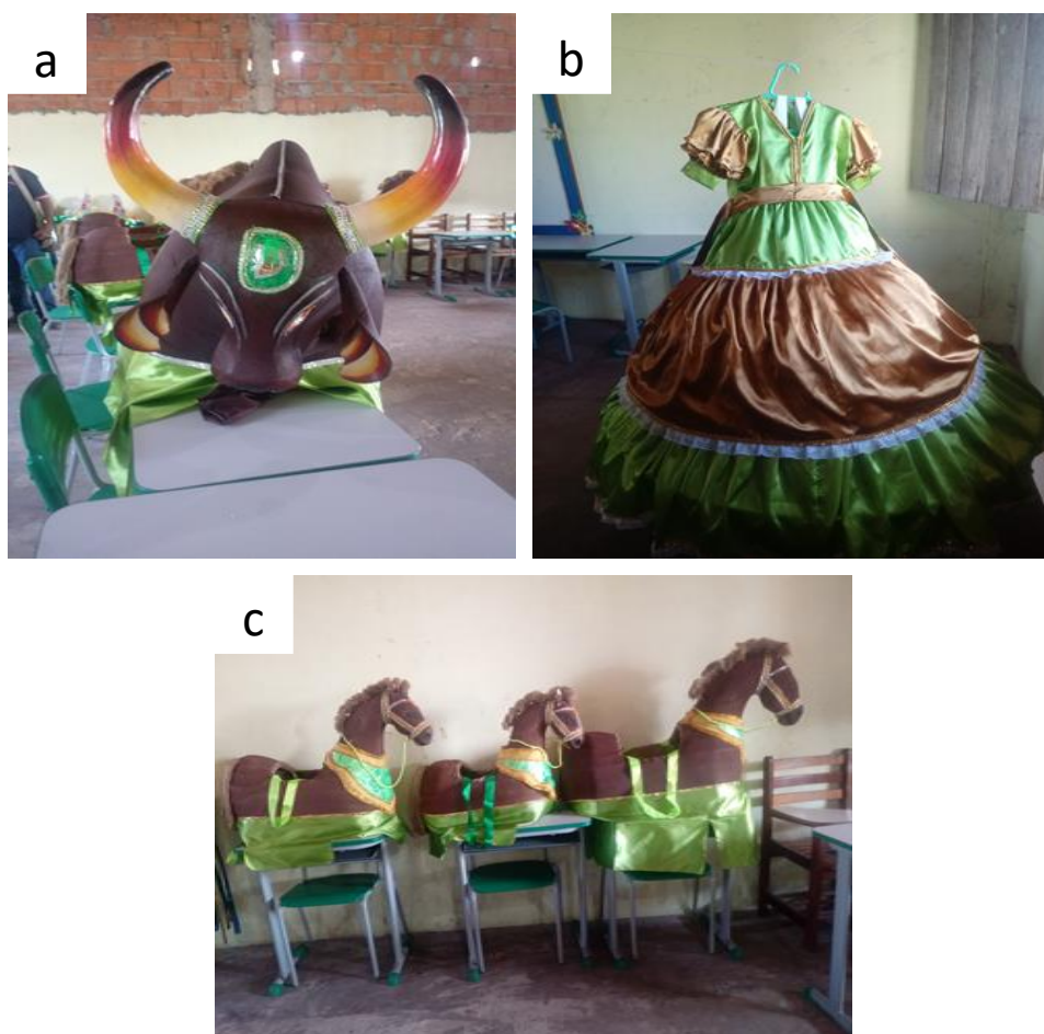
Figura 6- Boi-Bumbá Dengozinho a) boizinho Dengozinho, b)vestido da sinhazinha, c)cavalinhos da vaqueirada.

No mês de junho, a comunidade promove festas juninas com a brincadeira do boizinho “Dengozinho”. As crianças aprendem assim a brincadeira de boi-bumbá que tem aspectos do Garantido e Caprichoso, de Parintins. Em relatos dos comunitários, a brincadeira de boi é bastante antiga entre os comunitários. Atualmente, o boizinho se apresenta na comunidade e depois é levado em outras comunidades para a brincadeira. Todos os adereços e fantasias são confeccionados manualmente como mostra a figura 6.