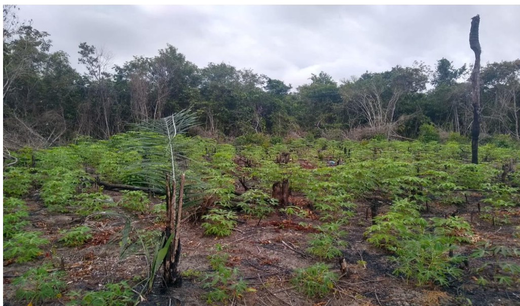
Figura 10- Plantação de Mandioca.

De acordo com as observações na comunidade Nossa Senhora de Nazaré, as iniciativas da “agricultura familiar” da comunidade sofrem necessidades, técnicas (maquinários e profissionais que orientem) e econômicas (investimentos), os agricultores sentem essa realidade de forma negativa e anseiam supri-las.