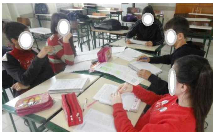
Figura 2: Elaboração das sínteses, a partir de leituras e do apoio do professor de Física.

A atividade central para o desenvolvimento da unidade consistiu no estudo de quatro temas distintos 5 a partir da organização das equipes de trabalho. Cada equipe recebeu um tema para o desenvolvimento e, a partir de diferentes materiais de apoio (livros, artigos científicos, vídeos, fotos), os estudantes organizaram apresentações (figura 2), apresentados e discutidos, posteriormente, para que os conhecimentos pudessem ser socializados, na forma de seminário. Nesta fase, o professor atendia às equipes e as orientava na organização das atividades.