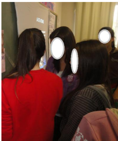
Figura 3: Apresentação das sínteses produzidas sobre a Desmistificação de crenças acerca do arco-íris.

científicas, comparando-se o texto lido com o vídeo assistido. A unidade foi finalizada com a produção de um material informativo realizado pelos estudantes referente aos estudos e seminários realizados durante a aula de Física.