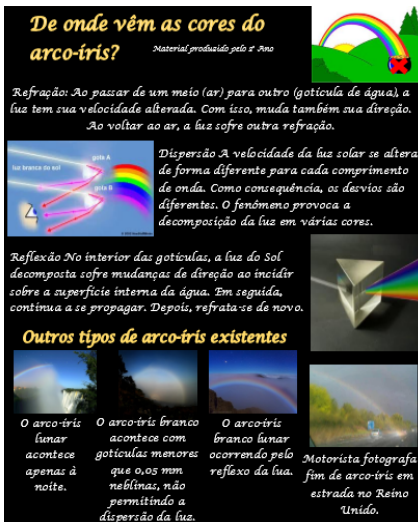
Figura 4: Material informativo elaborado pelos estudantes acerca do tema arco-íris.