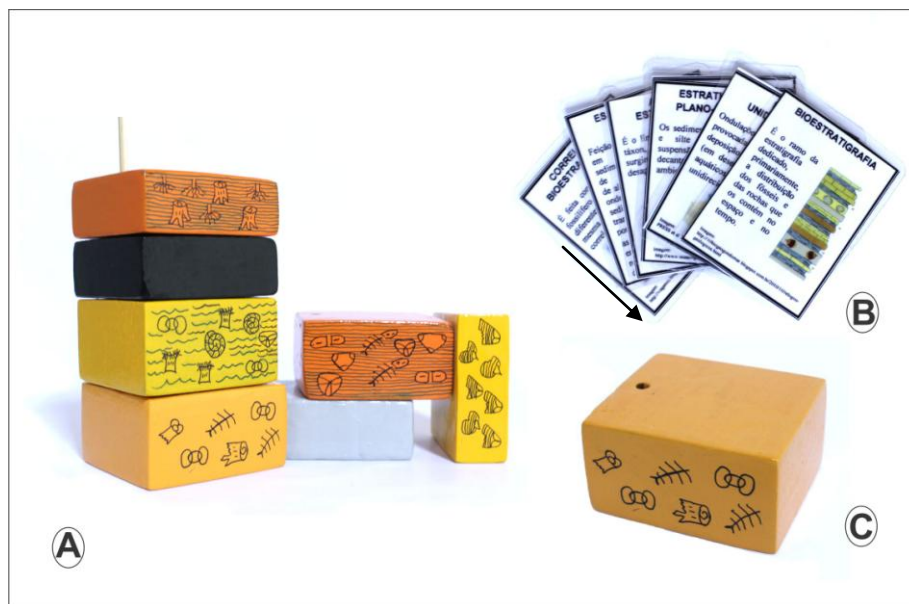
Figura 1: O jogo A Vida em Camadas. A) Perfil composto por blocos de madeira; B) Cartas informativas que são utilizadas pelos jogadores para consulta durante as jogadas; C) Detalhe de um bloco de madeira contendo um furo em uma das extremidades (seta) para encaixe no palito de churrasco durante a montagem do perfil.

A pesquisa foi desenvolvida com acadêmicos do curso de Ciências Biológicas da Universidade Estadual de Roraima (UERR), Campus Boa Vista . Escolheu-se trabalhar na disciplina de Paleontologia, ofertada no oitavo semestre do curso, em uma única turma composta por 34 acadêmicos utilizando-se o jogo didático “A vida em camadas” (Fig. 1) aplicando-o atrelado ao método de resolução de situações-problema no ensino (GOI e SANTOS, 2014) contendo conceitos e raciocínios típicos da Paleontologia. O jogo foi elaborado para essa pesquisa e busca, através de um perfil estratigráfico, abordar de maneira ampla e integrada diversos conceitos importantes que são trabalhados nesta disciplina.