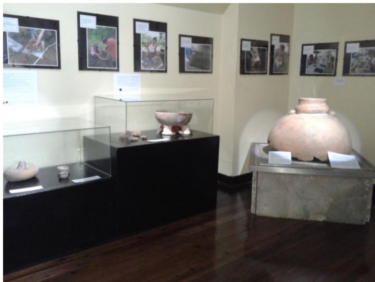
Figura 12: Exposição de longa duração do Museu Amazônico. 1º Momento: O passado do homem amazônico.