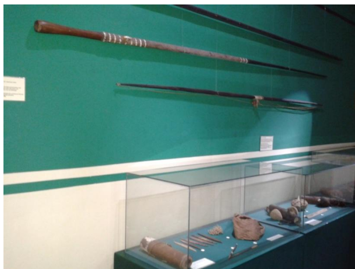
Figura 13: Exposição de longa duração do Museu Amazônico. 3º Momento: O homem caçador.