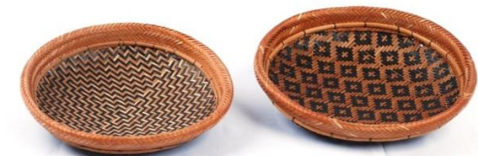
Figura 11: Conjunto de Apas, da etnia Tukano.