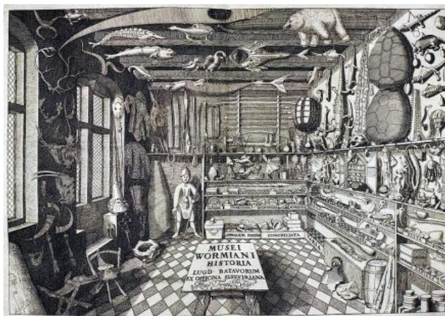
Figura 1: Gabinete de Curiosidades –Frontispício do MuseiWormiani História.

Dias (2007) e Costa (2011) entendem que o museu, enquanto instituição, sempre esteve associado às ciências. Inicialmente ligado à história natural e à história da arte, com as coleções dos estudiosos da natureza e as da Igreja, que viu nas artes uma maneira de propagar a Religião Católica. Mais tarde, foram se associando a outras ciências, tais como História, Arqueologia, Anatomia, Geologia, Paleontologia e Etnografia.