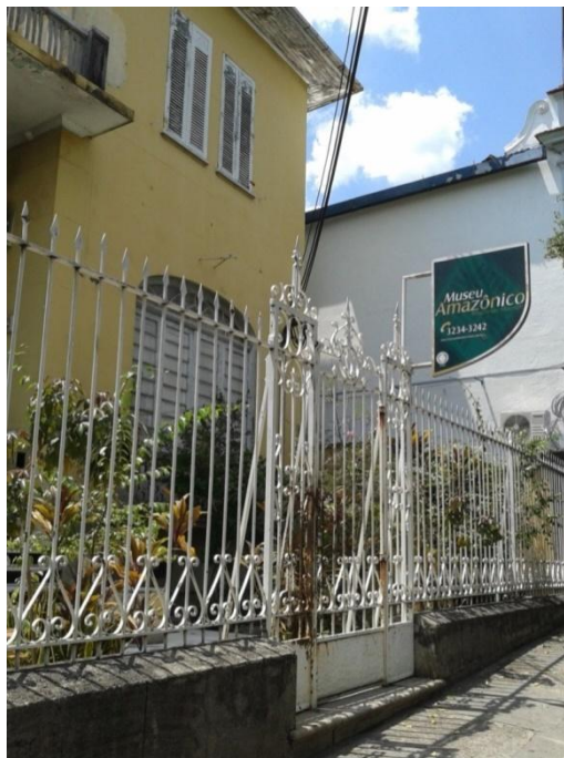
Figura 9: Fachada do Museu Amazônico.