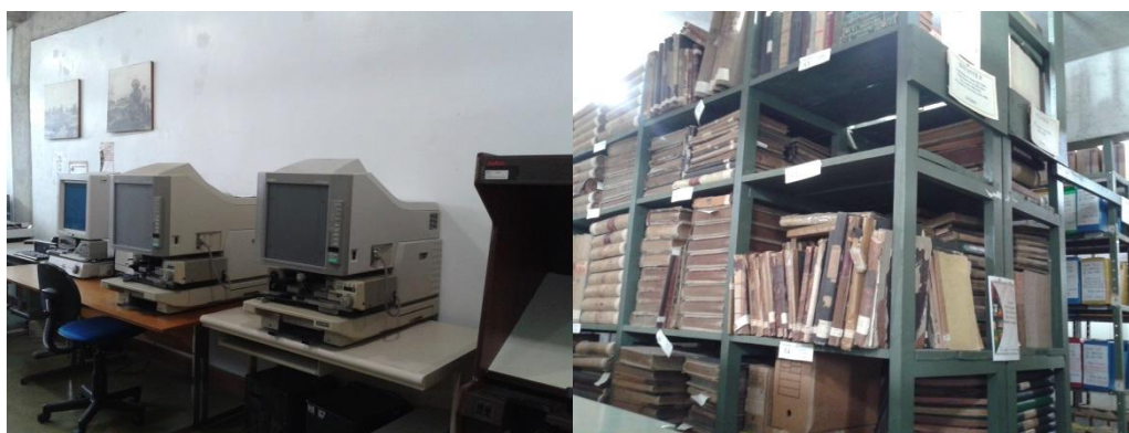
Figuras 4 e 5: Equipamentos de microfilmagem e Centro de Documentação.

- Divisão de Documentação e Pesquisa Histórica, composta por uma Central de Documentação, propõe e gerencia projetos de pesquisa vinculados aos acervos documentais, bem como faz a devida divulgação das fontes salvaguardadas. Nela, além da Diretora da Divisão, há um documentarista.