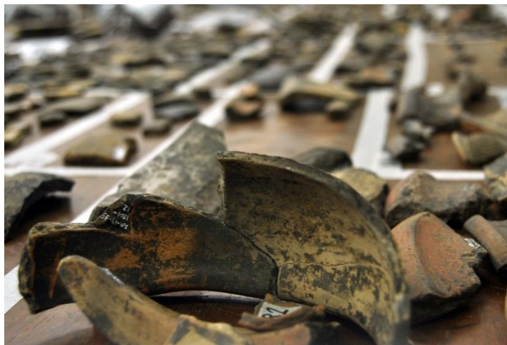
Figura 10: Peças da coleção de fragmentos arqueológicos do Museu Amazônico.

Relacionadas com Arqueologia da Amazônia, são formadas por fragmentos de artefatos de cerâmicas, pontas de flechas, lâminas de machado, urnas funerárias e amostras de solos que registram e divulgam vestígios das atividades humanas desenvolvidas no passado, sobretudo no Estado do Amazonas.