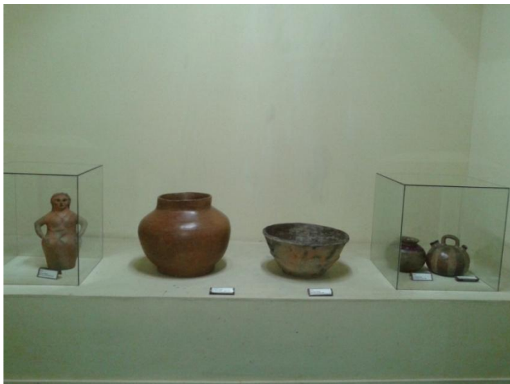
Figura 16: Exposição de longa duração do Museu Amazônico. 6º Momento: A arte popular.