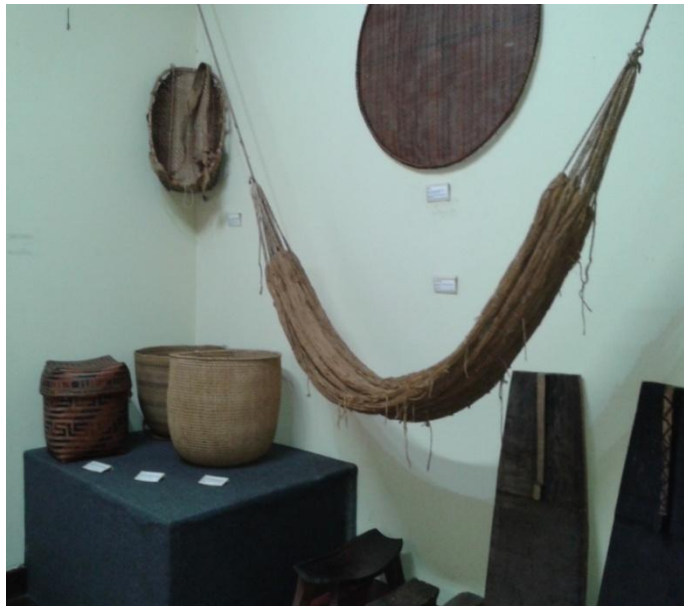
Figura 14: Exposição de longa duração do Museu Amazônico. 4º Momento: O cotidiano indígena.