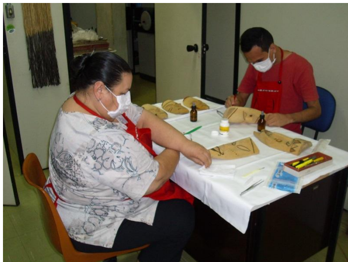
Figura 7: O serviço de restauro.

- Biblioteca Setorial do Museu Amazônico, está diretamente ligada a Biblioteca Central da Universidade e atende tanto às necessidades informacionais da equipe do Museu, como também as do PPGAS e da sociedade como um todo. Tem como seu principal tema a Amazônia. Nela atuam dois bibliotecários, sendo uma a Diretora.