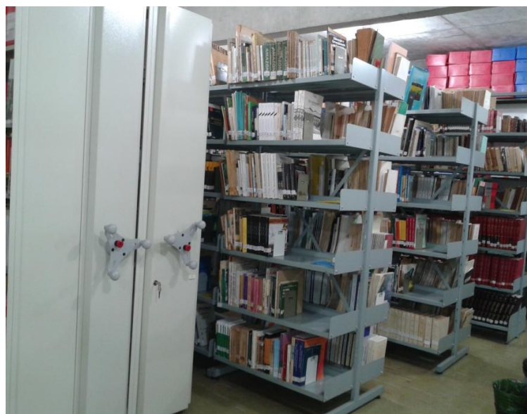
Figura 8: Biblioteca Setorial do Museu Amazônico.

- Biblioteca Setorial do Museu Amazônico, está diretamente ligada a Biblioteca Central da Universidade e atende tanto às necessidades informacionais da equipe do Museu, como também as do PPGAS e da sociedade como um todo. Tem como seu principal tema a Amazônia. Nela atuam dois bibliotecários, sendo uma a Diretora.