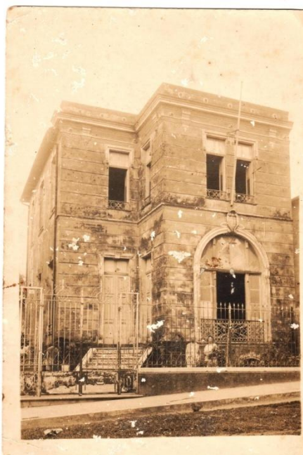
Figura 2: Edificação como residência particular Fonte: desconhecida, [ca.1920].

O imóvel pertencia à família Coelho e foi adquirido pela UFAM em 1972. Antes de abrigar o Museu Amazônico, a casa acolheu outros setores da Universidade, como a Faculdade de Artes. Estima-se que a edificação, outrora residência particular, remonta aos anos de 1920 e não existem registros de reformas em seu prédio original.