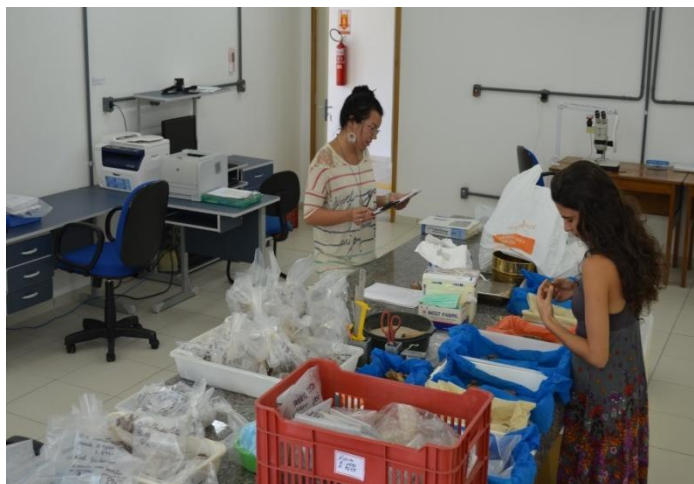
Figura 6: Atividades no Laboratório de Arqueologia.

Laboratório de Arqueologia, localizado no Setor Sul da Universidade (Mini-Campus), é responsável pela salvaguarda do acervo arqueológico sob a guarda do Museu. Realiza pesquisas de campo e desenvolve atividades de educação patrimonial, na área da Arqueologia. Além do Diretor, conta com uma equipe temporária formada por três arqueólogos, uma museóloga e uma restauradora.