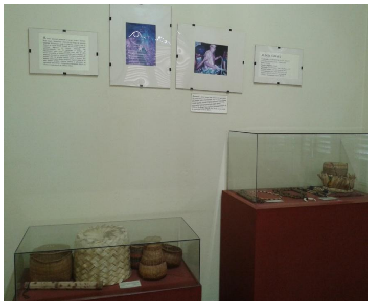
Figura 15: Exposição de longa duração do Museu Amazônico. 5º Momento: A medicina da floresta.