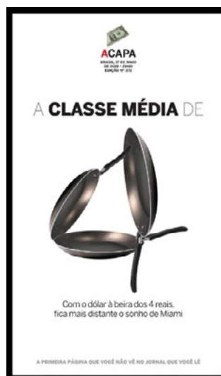
Figura 2: ACapa , 17 de maio de 2018