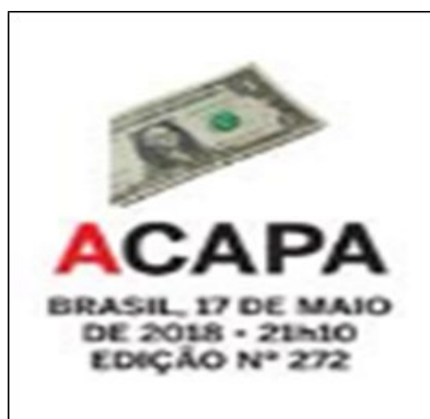
Figura 4 – A logomarca